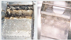
Séparateurs de graisses