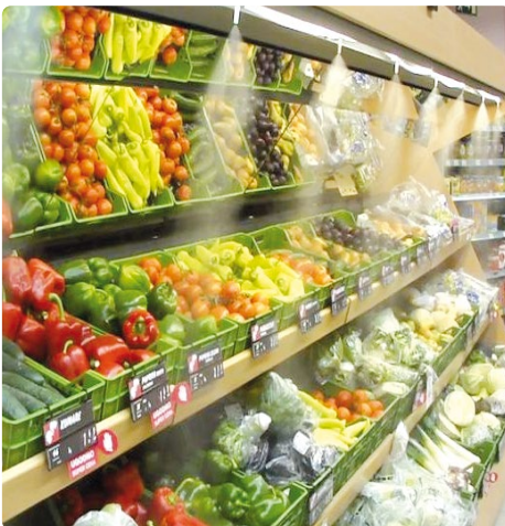
Brumisateurs dans les rayons alimentaires